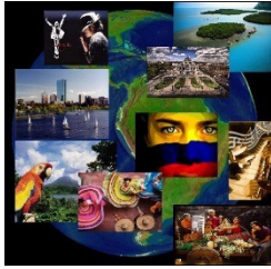
El arte y la música en los pueblos del Mundo